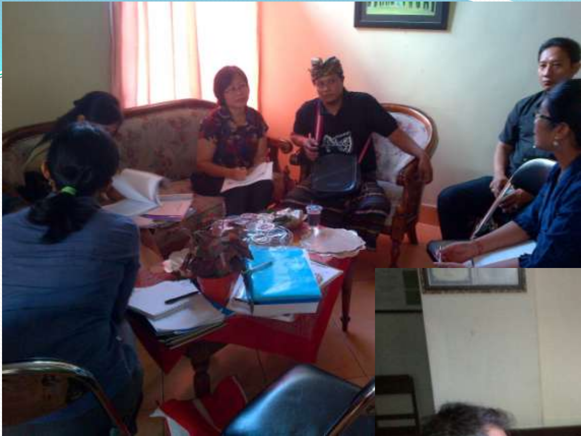
Rapat kerja I-PSM bersama BKM Sambadha