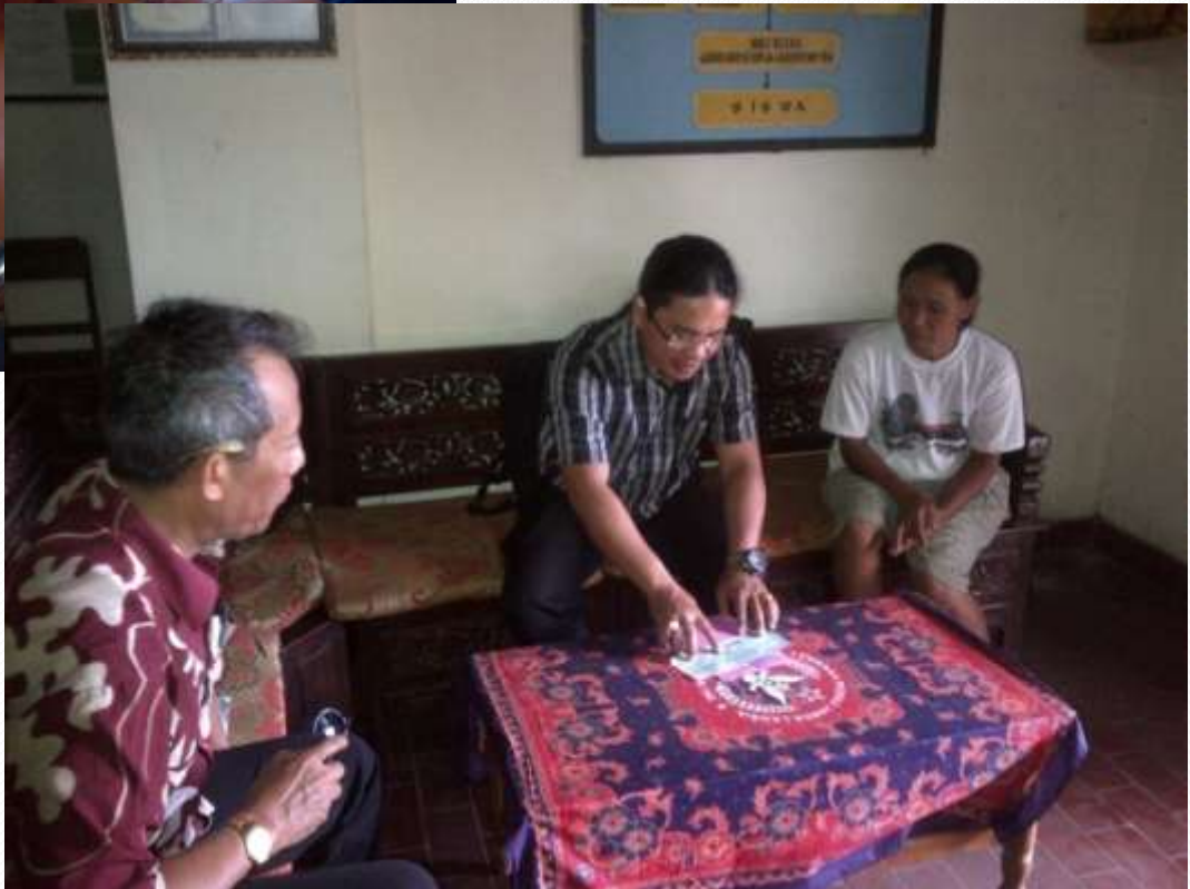
Fasilitasi penyerahan bantuan beasiswa miskin di SMP Pemecutan